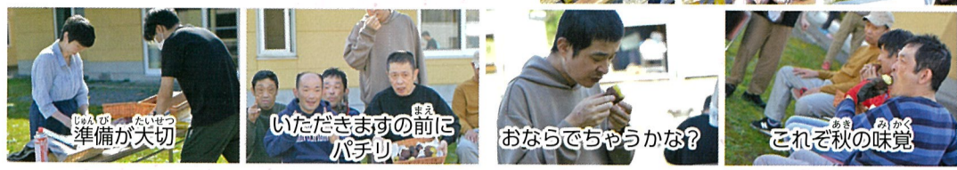
おいしく できるかな? おいしく できるかな? これは私の これぞ秋の味覚

秋の醍醐味 焼き芋作りをしました。★さつまいもを濡れた新聞紙とアルミホイルで包み、焼き台でじっくり焼いて完成です。🍠 ホクホクの焼き芋を食べて、食欲の秋を楽しみました。🎵