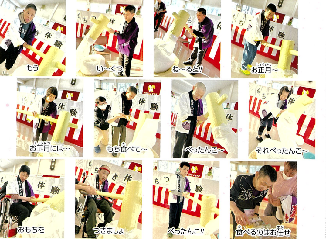
もう い〜くつ ね〜ると!! しょうがつ お正月には~ もち食べて~ べったんこ~ それべったんこ~ おもちを つきましょ べったんこ!! 食べるのはお任せ

食堂でもちつき体験を行いました。🍡段ボールで作られた臼と杵を使用し、みなさん楽しみながらおもちをつかれていました。🎵もちつき後は、ソフト大福が提供され、いろいろな味の大福を選んで頂きました。🌟