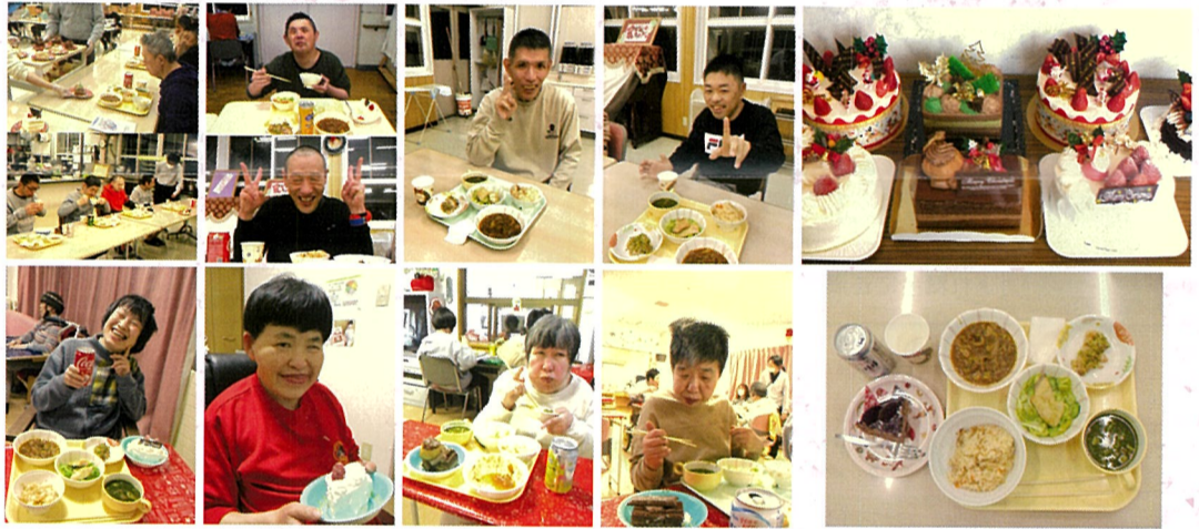
「クリスマス」ってなんか特別なんですよ!!

スパニッシュライス・ほうれん草のスープ・ビーフストロガノフ風・チキンの香草風味焼き・サーモンのカレーマリネサラダ・クリスマスケーキ・飲み物です。みなさん食べるペースが早く、きれいに完食されていました。🎵ボリューム満点のクリスマスメニューにみなさん大満足されていました。🎵クリスマスケーキは家族の会から助成いただき、数種類のケーキを購入しました。利用者さんには好きなケーキを選んでいただき、人気はチョコケーキでした。🎵おいしいケーキをありがとうございました。🎵