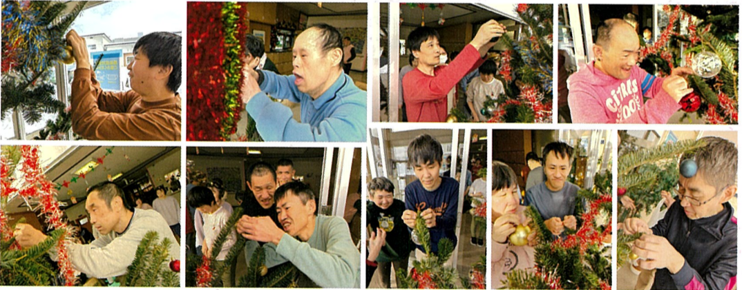
ワクワクが止まりませんね

今年も翠光園様より大きなクリスマスツリーをいただきました。🎄いつも大きなツリーをありがとうございます。🎵いただいたツリーはサロン係で、煌びやかに飾り付けしました。🎵