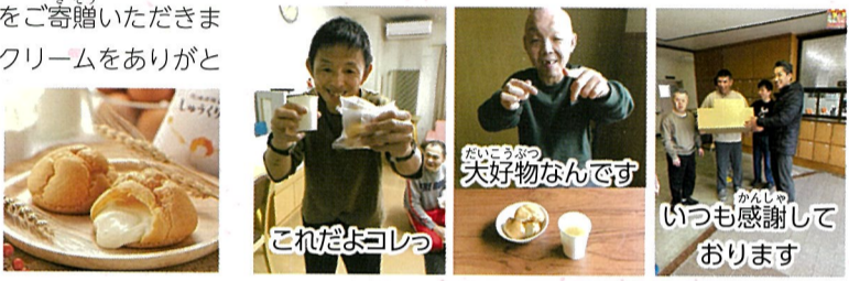
これだよコレっ 大好物なんです いつも感謝しております

梅屋様よりシュークリームをご寄贈いただきました。🍰毎年おいしいシュークリームをありがとうございます。🎵