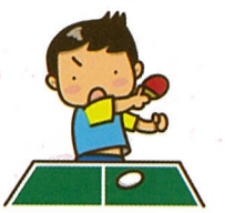
私はいつも真剣なのだ くらえ必殺サーブ!!